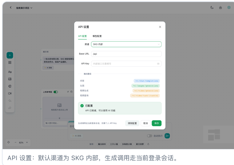
API 设置：默认渠道为 SKG 内部，生成调用走当前登录会话。

平台默认使用 SKG 内部生成接口。普通员工不需要填写 API Key，也不需要改 Base URL。