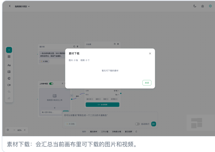
素材下载：会汇总当前画布里可下载的图片 and 视频。

生成的图片和视频会保存在当前账号自己的项目里。当前画布里有可下载素材时，右上角下载图标会高亮。